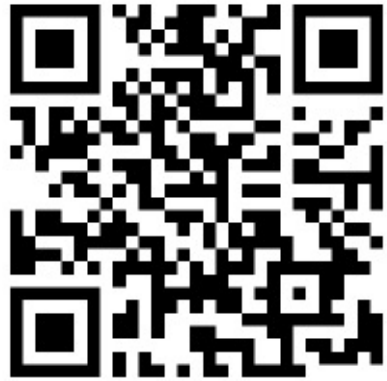
店舗利用状況確認ページ 二次元コード

配布された二次元コードが自分の店舗であるか確認 ①三角POP(二次元シール)と ②A4版 二次元コード用紙